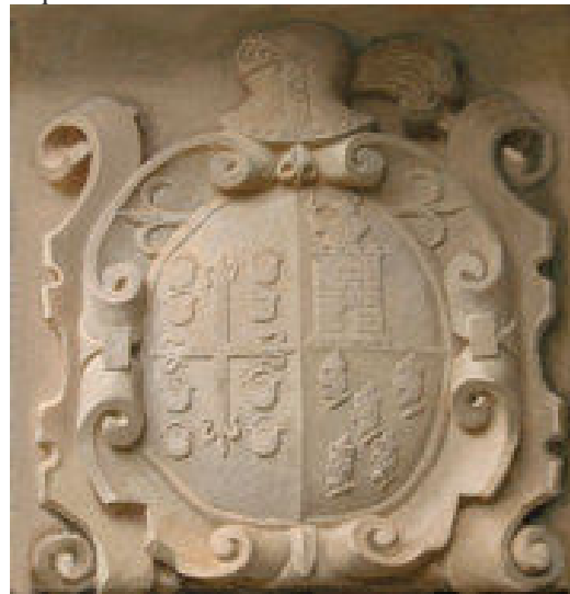
5. Fotografía del escudo en su ubicación actual

El escudo , (foto 5) labrado en piedra, presenta un buen estado de conservación. Es de la primera mitad del siglo XVII. Lleva acolada la cruz de Santiago. El morrión mira hacia la izquierda.