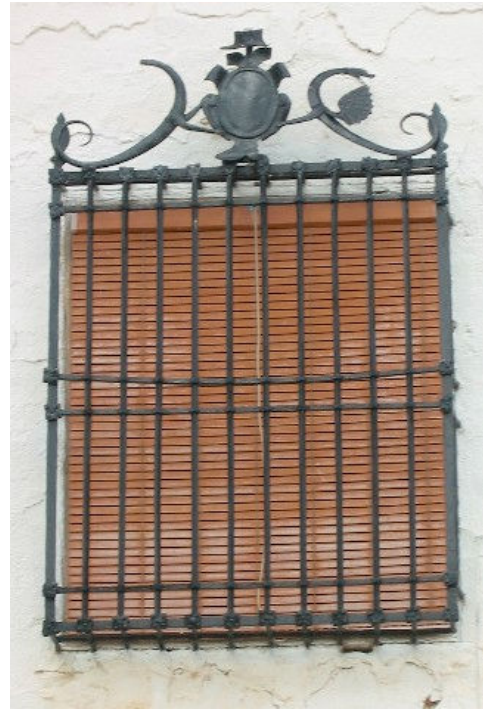
15 .Reja de la fachada principal

nombre “Montenuevo” de propiedad particular entre otros objetos de indudable valor.