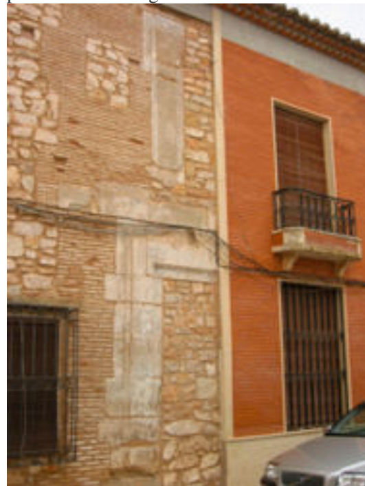
8. Restos de la portada principal

Tras la partición y reparto de la casa, ésta ha sido completamente alterada. La mitad de la parte noble con portada (fotos 8 y 10), zaguán y patio ha sido totalmente destruida en los años sesenta del pasado siglo y levantada una casa de nueva planta de dudoso gusto.