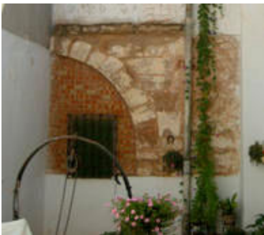
11. Antigua salida al patio desde el zaguán

El acceso a la mitad del patio que se ha conservado, ha sido modificado. El arco de medio punto está tapiado en la actualidad, configurando una habitación en lo que fue la mitad del zaguán (foto 11), por lo que se ha realizado una nueva puerta en línea con el lateral izquierdo del patio, siendo ésta el acceso principal de la vivienda. También se eliminó la escalera