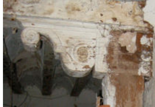
7. Zapata del corredor alto

descansan tirantes formando bovedillas, sustentadas por zapatas de perfil de acanto, sobre pies derechos de sección cuadrangular. Una balaustrada, de elementos torneados de madera, recorre el conjunto de la galería. Se remata con cubierta a cuatro aguas terminando en forma de alero con canecillos de madera de perfil partido. Las zapatas que se pueden ver en este corredor son de perfil de acanto, en "S" y lobuladas (foto 7).