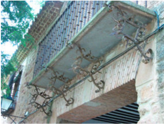
9. Balcón en su ubicación actual (detalle)

con alguna de las rejas, en la fachada y portada de acceso al santuario (foto 9) de Nuestra Señora de La Antigua en Villanueva de los Infantes, donde pueden verse en la actualidad.