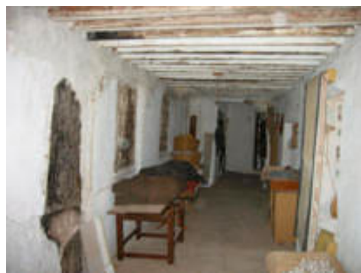
14. Panda izquierda del corredor alto. Cerrado

El corredor alto (foto 14) ha sido tapiado, manteniendo embutidos en la obra los pies, zapatas y parte de la balaustrada de madera, lo que posibilita una futura restauración. Las columnas 4 del corredor inferior, también tabicado, han sido sustituidas por grandes pilares (foto 12).