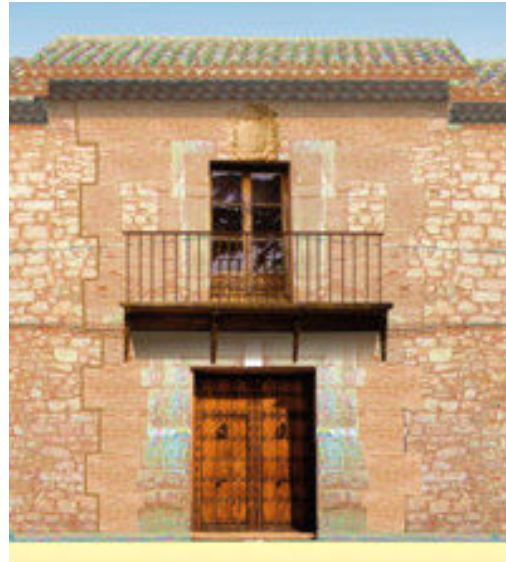
4. Reconstrucción de la portada principal

La portada principal (foto 4) se resuelve con dos cuerpos de sillería adintelados, decorados con moldura mixtilínea. Enmarcada con unos paramentos de ladrillo sobre fachada de mampostería.