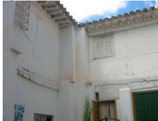
12. Corredor alto tapiado

principal, creándose otra funcional de modestas dimensiones. El enlosado del patio ha sido levantado y sustituido por una capa de cemento.