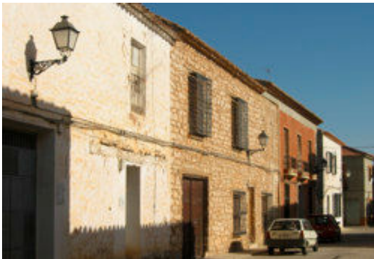
10. Situación actual de la fachada principal