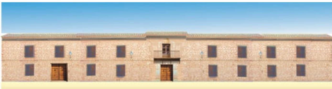
Reconstrucción de la fachada principal

Contribuir a la recuperación de la memoria histórica de Villahermosa es el motivo del presente estudio, antes de que la piqueta y múltiples intereses acaben con los retazos de arte y arquitectura de la villa. Para que se sienta orgullosa de su pasado.