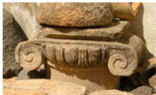
13. Capitel de columna del patio

El corredor alto (foto 14) ha sido tapiado, manteniendo embutidos en la obra los pies, zapatas y parte de la balaustrada de madera, lo que posibilita una futura restauración. Las columnas 4 del corredor inferior, también tabicado, han sido sustituidas por grandes pilares (foto 12).