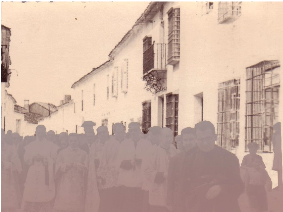
16. Fachada en 1958. Muy alterada en la distribución de vanos con el balcón y rejas originales.