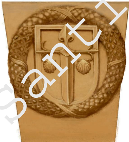
Escudo con la Cruz de Santiago sobre la puerta principal de la Casa de la Encomienda.

En Villahermosa, por estas fechas, no se había comenzado todavía la construcción de la iglesia actual; solo había una ermita, la de San Pedro 1 . La casa de la Encomienda estaba en mal estado; “... están todos los suelos quebrados e apandados e los arcos del portal delantero hendidos, de manera que está toda apuntalada e con mucho peligro... Mandaron al comendador en presencia de su mayordomo que la parte de la puerta principal de largo a largo que agora está apuntalada por de dentro e por de fuera... la haga derribar toda e hacerla de nuevo a cal y canto” 2 . Toda la casa en general experimenta una reforma, mandándose construir la parte izquierda (la más alta) para bastimento. La población de la villa aumentó notablemente desde los 375 habitantes que tenía al inicio de la comendaduría de don Iñigo Dávalos, a los 1054 habitantes en 1496.