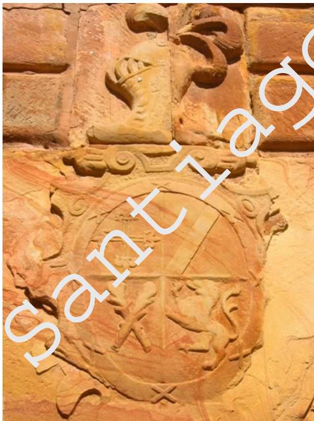
Escudo de armas de don Vespasiano Gonzaga

Grande de Castilla, Virrey y Capitán General de Valencia, Señor de las siete villas de Alcaraz, Caballero de la Orden de Santiago. Nació en Guastala el 8 de septiembre de 1621 y falleció el 3 de mayo de 1687. Fue Comendador de Villahermosa por fallecimiento de su hermano don Fernando, desde el 2 de junio de 1678. Casó en 1646 con Doña Inés María Manrique de Lara décima Condesa de Paredes de Nava, Grande de España, Señora de Villapalacios. Villahermosa termina el siglo XVII rondando los 2000 habitantes.