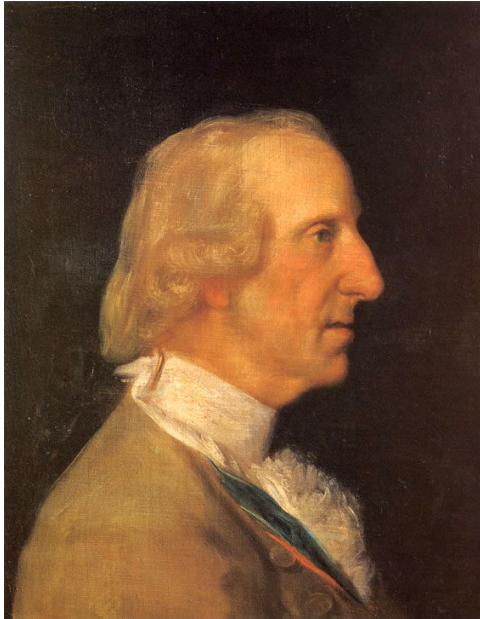
Goya. Luís Antonio Jaime de Borbón

retratos. Fallece el 7 de agosto de 1785, reposando sus restos en el panteón de El Escorial.