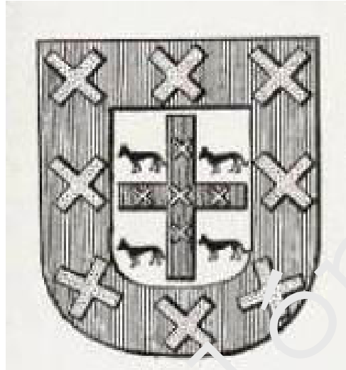
Escudo de los Orozco