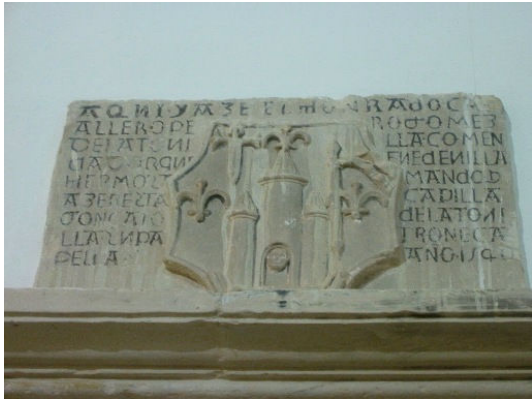
Escudo de armas de don Pedro Gómez de la Tovilla

GONZALO DE LA TOVILLA, SU PATRÓN E CAPELLÁN. AÑO 1540.”