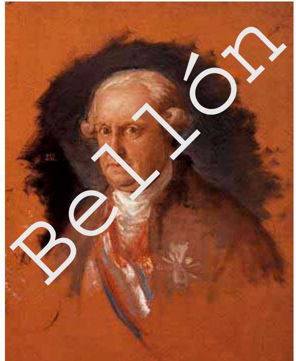
Goya. Antonio Pascual de Borbón