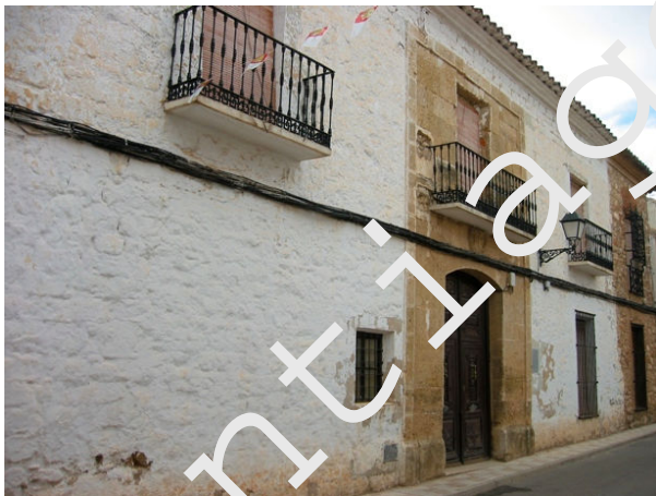
Casa de la Encomienda

La Orden de Santiago, al final del periodo medieval, era poseedora de grandes territorios, para cuyo control se dividieron en unidades administrativas, llamadas "Partidos". A su vez éstos se componían de unidades menores de origen visigótico, llamadas Encomiendas. Villahermosa era pues una Encomienda del partido de Infantes.