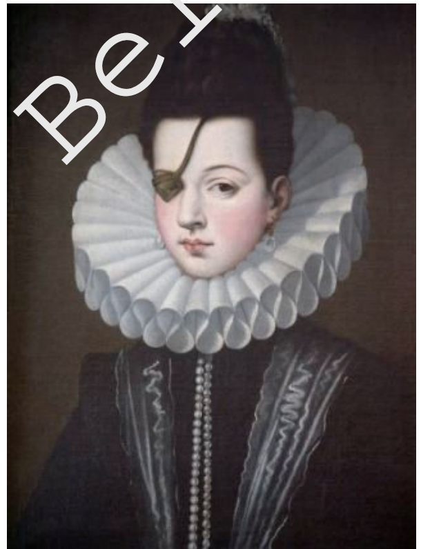
Princesa de Éboli

Al mismo tiempo que tuvo la encomienda de Villahermosa, fue Virrey de Cataluña (1564-1571). Príncipe de Melito y duque de Francavilla (ambos en Nápoles). De su matrimonio con Catalina de Silva, hija de los condes de Cifuentes, nacería la famosísima Ana de Mendoza y la Cerda, duquesa de Pastrana y, por matrimonio, Princesa de Éboli. Tras el dudar de Catalina, se casa con Magdalena de Aragón (1576), para lograr un heredero varón (o perjudicar a su hija y yerno, los Príncipes de Éboli). Sin embargo murió en 1578, dejándola embarazada de una niña que muerta al poco de nacer.