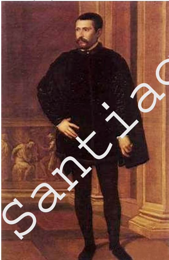
Tiziano, hacia 1541. Diego Hurtado de Mendoza (identidad atribuida dudosa)

Fue uno de los personajes más relevantes del renacimiento español. Hijo de don Diego Hurtado de