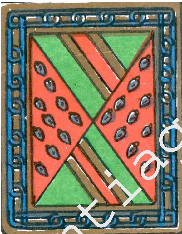
Escudo utilizado por los Marqueses de Almazán y Condes de Monteaquedo