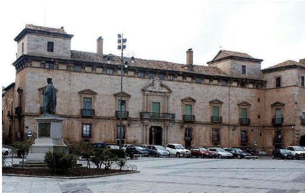
Almazán, Palacio de los Hurtado de Mendoza. Fachada, torres y reforma interior realizada por el Comendador

de Guerra. El 25 de junio de 1579 promociona a la Encomienda de Beas de Segura. Desde 1579 a 1589 fue Virrey de Navarra. Muere el 18 de diciembre de 1591.