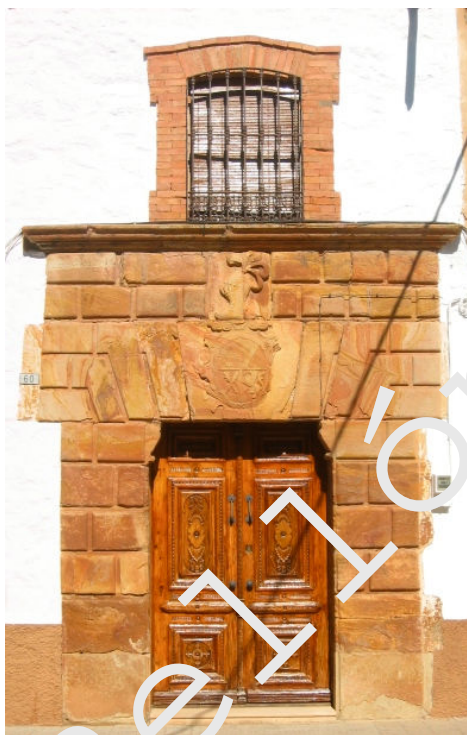
Villamanrique, casa de don Vespasiano Gonzaga