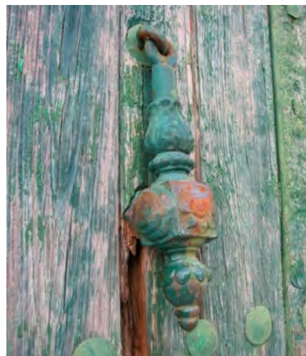
c/San Agustín s/n