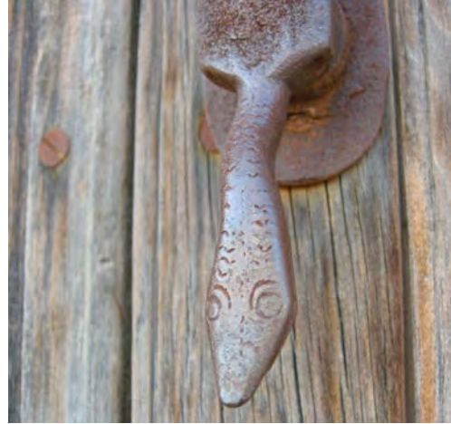
c/ Pretorio 13 (detalle)

Destaca también por su originalidad, el de la calle Pretorio 13, cuyo martillo adopta la forma de una serpiente elegantemente cincelada con decoración incisa de escamas a lo largo de todo el cuerpo y con una placa que engloba el espigón y durmiente en una misma pieza.