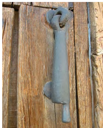
c/ Agua 7

Este modelo, con ligeras variantes, está representado en las calles Ramón y Cajal 17, San Agustín 6, Agua 7, Cardadores s/n, Cascabel s/n, Cura Vicario 14 o Castilla la Mancha 3 entre otros muchos. También se da con frecuencia el martillo de sección rectangular con esquinas facetadas decoradas con incisiones en zigzag y terminado en forma de bellota. Calles Encomienda 5, Encomienda 12 o Revuelta 9.