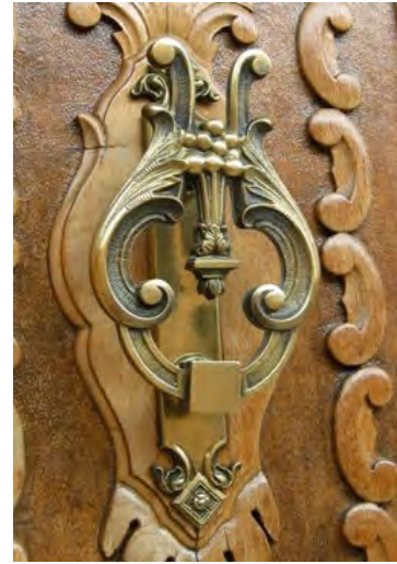
La López 9

Ya en el siglo XX el aldabón se hace muy asequible por su bajo precio y reproduce tres tipologías por un lado piezas de complicadas composiciones de inspiración en modelos franceses del siglo XVIII.