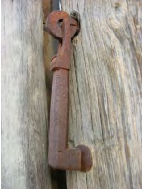
c/ Pretorio 14

Un modelo, con varios ejemplos, es el de sección rectangular con las esquinas facetadas, cuyo martillo adopta la forma de “L” y presenta unas caras con sencillas decoraciones incisas en forma de zigzag. Pretorio 14, Pretorio 21.