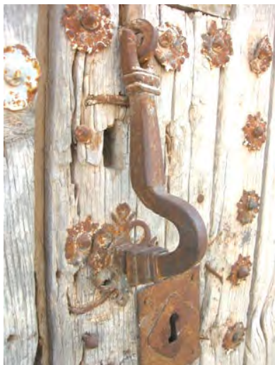
c/ Libertad s/n

El ejemplo más interesante, junto con toda la portada, es el de la calle libertad s/n, ya que además del aldabón con trabajos de placas caladas, conserva los herrajes originales de la puerta, con sus clavos y refuerzos todos ellos de trabajo de forja finamente realizados, dando el aspecto de una elegante filigrana.