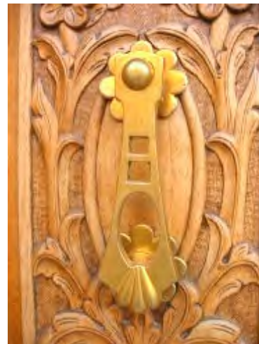
c/ La López 6

Con algún ejemplo de león como placa de cuyas fauces pende el martillo en forma de argolla, otra de inspiración neogótica, y las de nuevos diseños en consonancia con los estilos artísticos de cada momento. Se aprecia una tendencia modernista en ejemplos hasta bien entrada la década de los treinta del pasado siglo (Olvido 3, Olvido 20), así como elementos más cubistas o "Decó" (La López 6) hasta nuestros días.