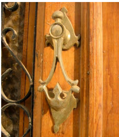
c/ La López 53