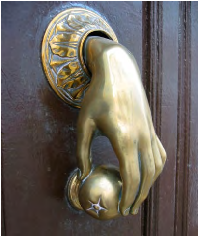
c/ Feria 3

Un modelo muy difundido es el de la mano que sujeta una bola de aspecto sólido que hace de martillo (en algunos casos la bola adopta la forma de fruta). La mano puede ir decorada con anillo en el dedo anular y sobre la muñeca unos detalles de la manga con sus encajes y telas.