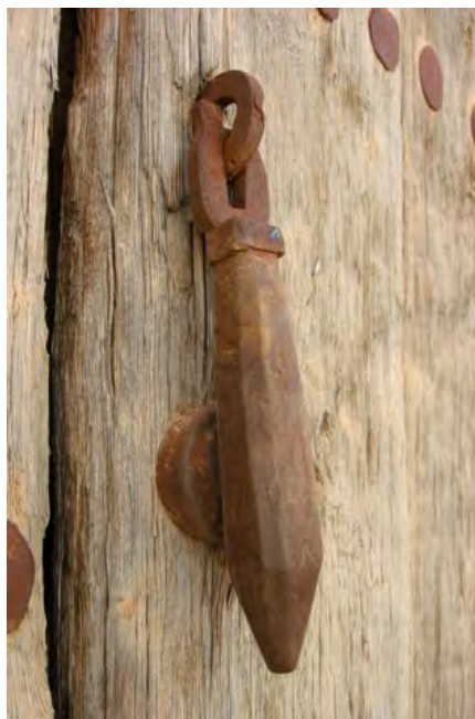
c/ Cardadores s/n

ejemplos más antiguos son de finales del XVII y principios del siglo XVIII. Responden a los estilos castellanos caracterizados por su robustez y austeridad. De estos siglos son las aldabas cuyo espigón, que las fijan a la puerta, es un simple clavo rematado al exterior en forma de argolla, y el martillo es una gruesa barra de aspecto fálico, con placa posterior rectangular.